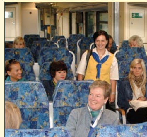
Freundlicher Service für die Fahrgäste der eurobahn.